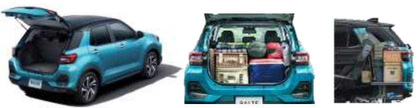
後席に人を乗せたまま、たっぷり積める使いやすい荷室スペース