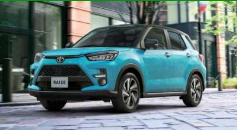
Photo: Z ボディカラー：ブラックマイカメタリック(X07)×ターコイズブルーマイカメタリック(B86)(XH6)(55,000円)はメーカーオプション。