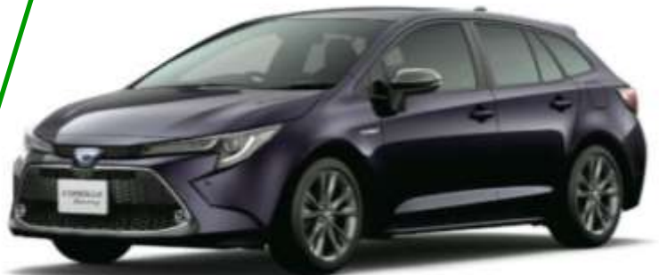
Photo: HYBRID W×B ボディカラー: スパークリングブラックパールクリスタルシャイン(220)はメーカーオプション(33,000円)